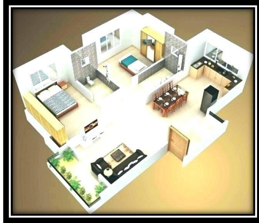
Rumah yang punyai banyak bilik

Jawapannya adalah anda masuk menggunakan pintu. Jawabannya mudah dan logik, bukan? Begitu lah juga konsep Google apabila ianya mula untuk crawling dalam website anda, anda perlu buat (setup) pintu demi pintu supaya setiap konten dan keyword yang anda mahu rankingkan dijumpai Google.